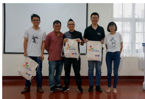
分享嘉賓紀念品頒發

不足，跨年齡的交流比訓導更有成效，學員更理解在職人士及稍年長的人的想法，探索相處之道。